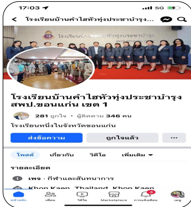
Page Facebook ของโรงเรียน

ผลการดำเนินงาน โรงเรียนบ้านคำไฮหัวทุ่งประชาบำรุง มีการส่งเสริมให้หน่วยงานมีการสื่อสารและการรับส่งข่าวสารต่างๆ และการนำเสนอเรื่องราว ความรู้หรือสิ่งอื่นใดที่ต้องการให้ผู้รับสารรับรู้และเข้าใจข้อมูล โดยมุ่งความรู้และ สร้างความเข้าใจ ที่ถูกต้องตรงกันและนำไปปฏิบัติงานที่โปร่งใสตรวจสอบได้อย่างหลากหลายรูปแบบ เช่น การประชุมชี้แจงผู้ปกครอง การทาจดหมายข่าว การประชาสัมพันธ์ออนไลน์ การจัดนิทรรศการ