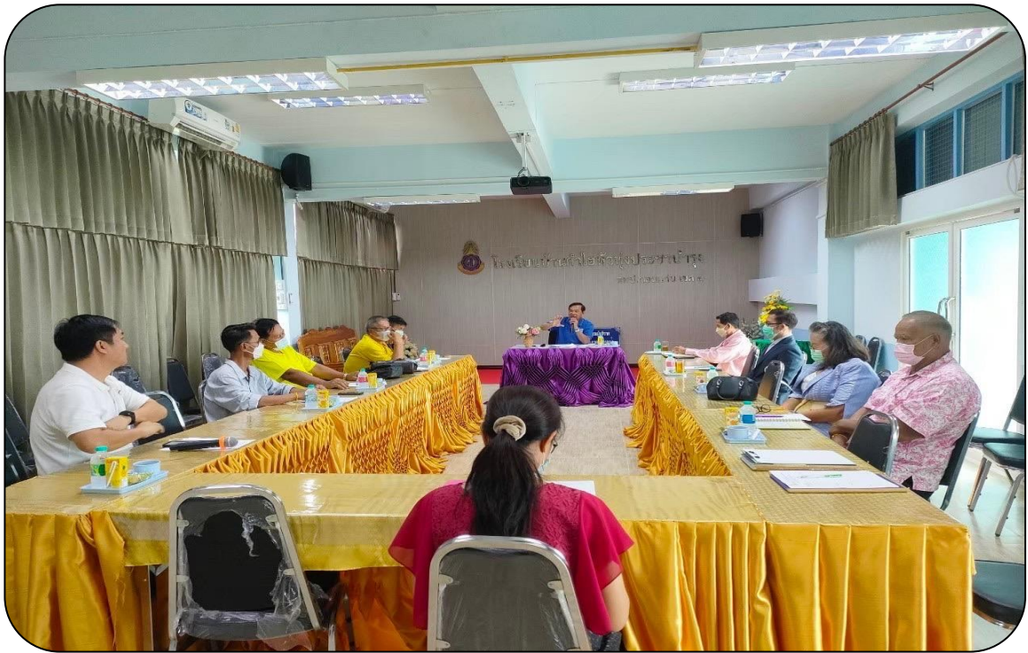
คณะกรรมการสถานศึกษาและผู้ปกครองมีส่วนร่วมในการวางแผนการบริหารสถานศึกษา