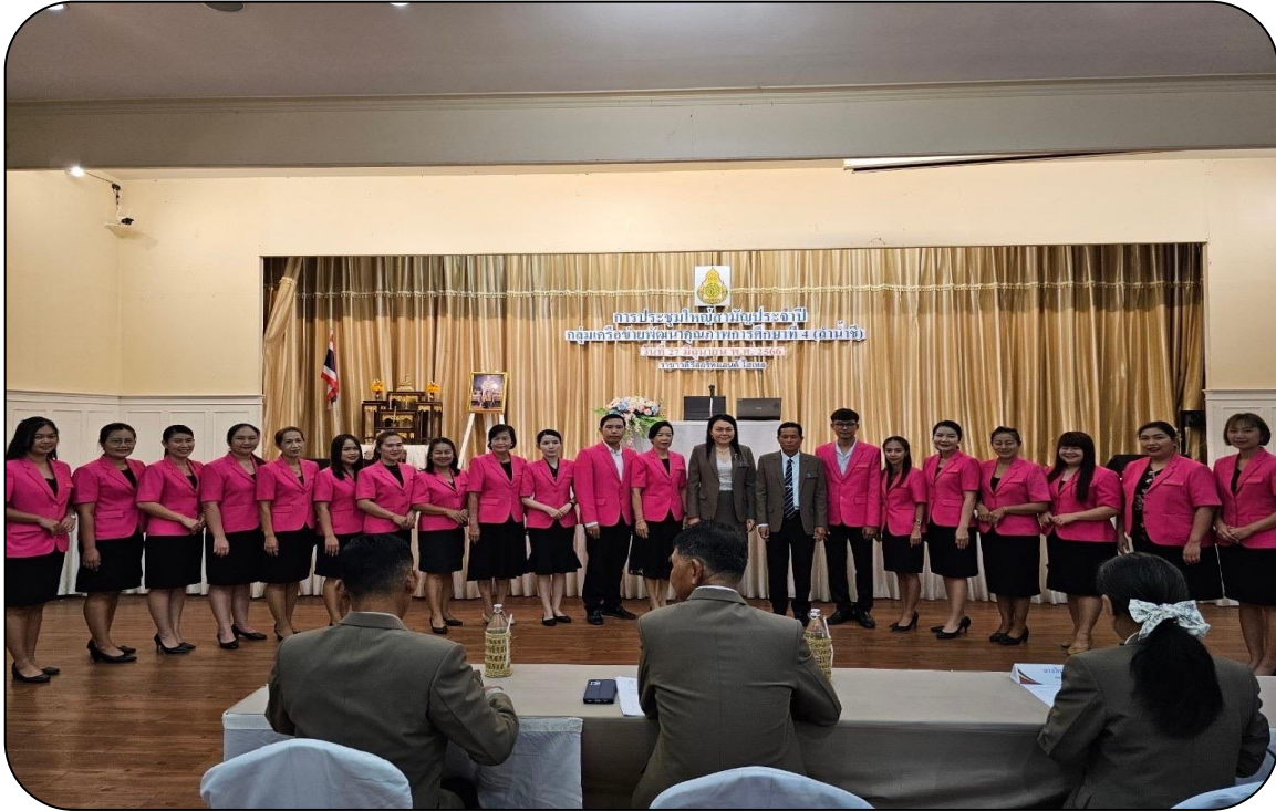
ประชุม/อบรม สร้างความรู้ความเข้าใจและลงนามความร่วมมือในการพัฒนา

มาตรการที่ ๓ ส่งเสริมบุคลากรทุกระดับให้มีความรับผิดชอบและสามารถตรวจสอบความ รับผิดชอบต่อการกระทำต่างๆ ได้