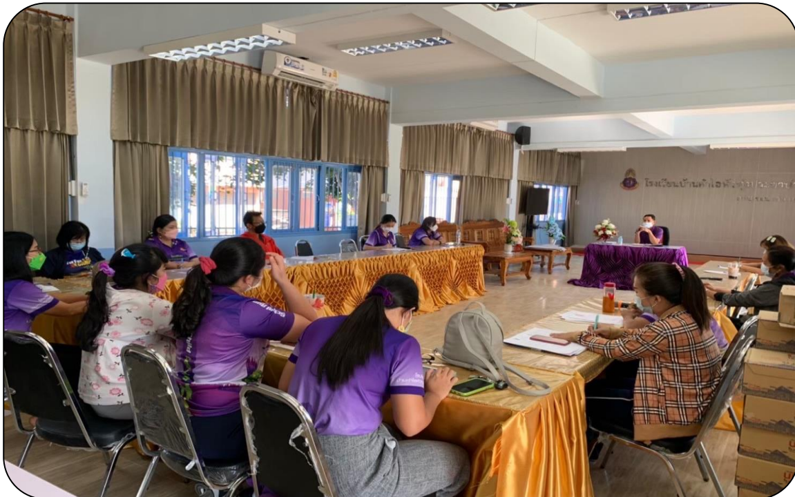
ประชุมมอบหมายงานตามภารกิจของสถานศึกษา

ผลการดำเนินงาน โรงเรียนบ้านคำไฮหัวทุ่งประชาบำรุง ได้มีการออกคำสั่งมอบหมายงานตามภารกิจของสถานศึกษา มีการ แต่งตั้งคณะกรรมการติดตามตรวจสอบการดำเนินงาน มุ่งเน้นการบริหารงานและพัฒนาทรัพยากรบุคคลอย่าง มีระบบ มีคุณธรรม การมีส่วนร่วม และตรวจสอบได้ ให้ความสำคัญกับการมอบหมายงานที่มีความเป็นธรรม เท่าเทียมและไม่เลือกปฏิบัติ