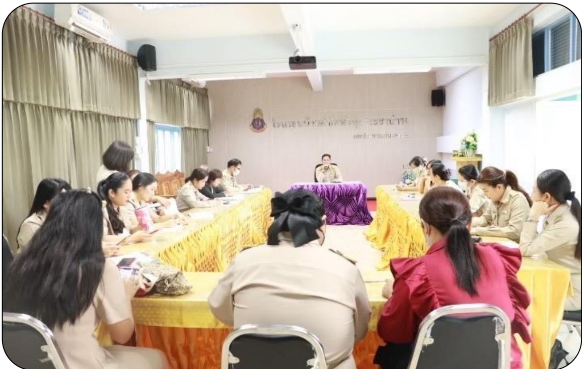
การกำกับติดตามการพัฒนาสถานศึกษาตามแผนงานและโครงการที่กำหนด

ผลการดำเนินงาน โรงเรียนบ้านคำไฮหัวทุ่งประชาบำรุง ได้ปลุกฝังค่านิยมและทัศนคติให้ครูและบุคลากรทางการศึกษาใน สังกัด การสร้างวัฒนธรรมสุจริตให้เกิดขึ้น ครูและบุคลากรทางการศึกษาในโรงเรียน ไม่ยอมรับพฤติกรรม การทุจริตคอร์รัปชัน และละอายที่จะกระทำ การทุจริตคอร์รัปชัน ส่งเสริมการติดตามตรวจสอบการบริหารงาน ของโรงเรียนให้มีประสิทธิภาพ ประสิทธิผล และมีความโปร่งใสตรวจสอบได้ เสริมสร้างความรู้ความเข้าใจ เกี่ยวกับการกระทำที่เป็นผลประโยชน์ทับซ้อนเพื่อให้ครูและบุคลากรทางการศึกษา ให้สามารถแยกแยะ ผลประโยชน์ส่วนตัว และผลประโยชน์ส่วนรวมได้